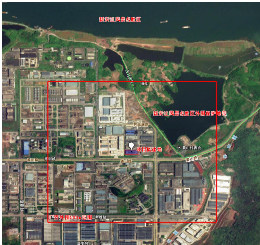
图 2.3-1 项目主要敏感保护目标分布图（500m，姜山村委已搬迁）